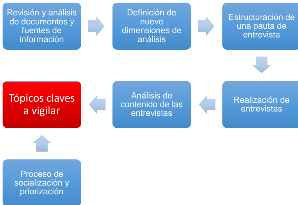
Gráfico 3. Diseño metodológico del estudio de campo

Con todo, el proceso metodológico diseñado e implementado puede verse graficado en la siguiente figura: